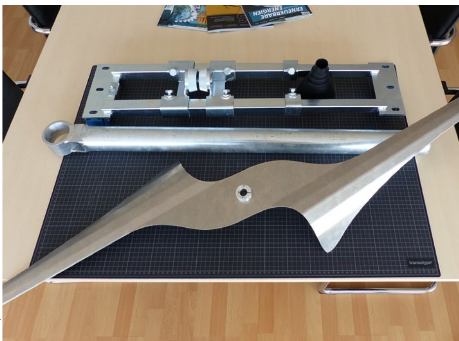
Übersichtlich angeordnet auf dem Tisch: Rotorblatt, Mast und Dachhalterung.